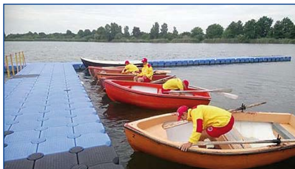
Ratownicy przed rozpoczęciem dyżuru na kąpielisku w Dębowej.