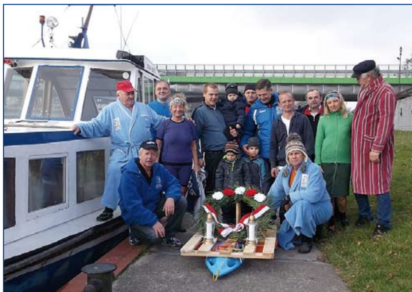
Morsy WOPR Dębowa – sptyw Odrą z okazji Dnia Niepodległości.