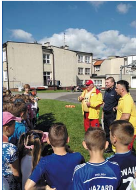
Edukacja dzieci i młodzieży w Baborowie i Oleśnie.