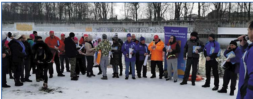
Powyżej i z lewej: Podsumowanie XIII splywu twardzieli rzeką Kłodnicą.