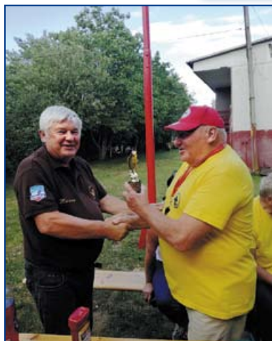
Współpraca z wędkarzami.