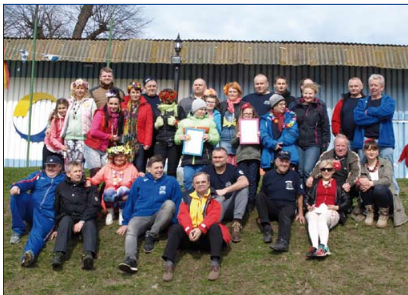
Podsumowanie 15-lecia morsów WOPR Dębowa na wyspie w Koźlu.