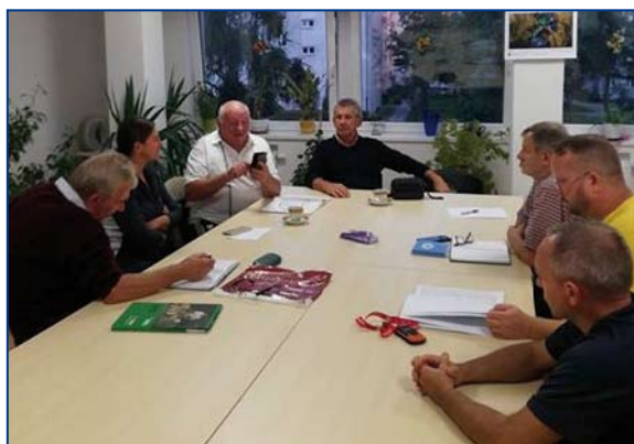
Zarząd WOPR podczas obrad.

Oddział działa w oparciu o 15 drużyn WOPR: