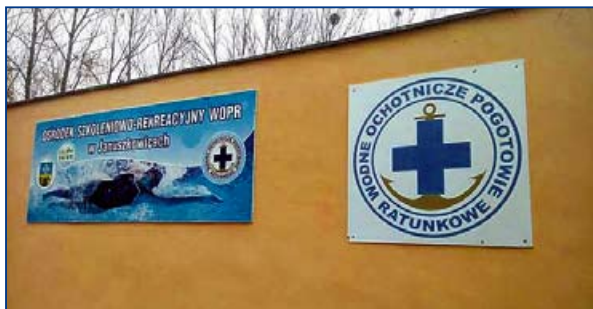
Stacja WOPR Januszkowice.

W roku 2015, po 25 latach, OR WOPR w Kędzierzynie-Koźlu powrócił na to piękne jezioro. Nastąpiło to m.in. w związku z powstaniem Ośrodka „Rueda” i koniecznością patroli akwenu. Dzięki staraniom prezesów oddział odzyskał wówczas stację w Januszkowicach. Od tego czasu trwa tam intensywny remont budynków.