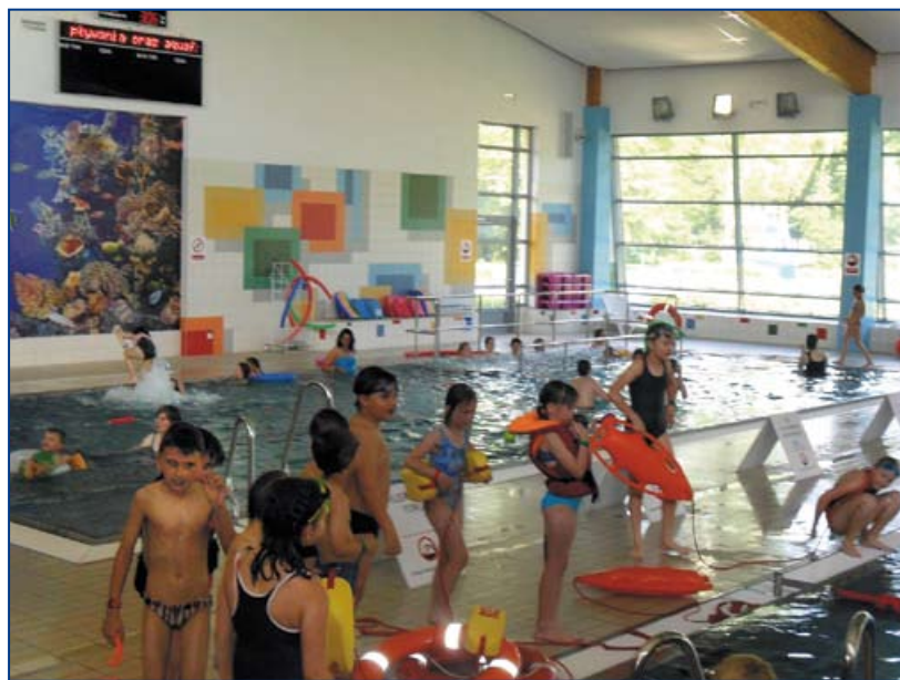
Nauka pływania dla dzieci – basen w Strzelcach Opolskich.

Do zabezpieczenia kąpielisk, w sezonach letnich, we wszystkich podlegających nam powiatach potrzeba około 70 ratowników zawodowych i około 40 społecznych.