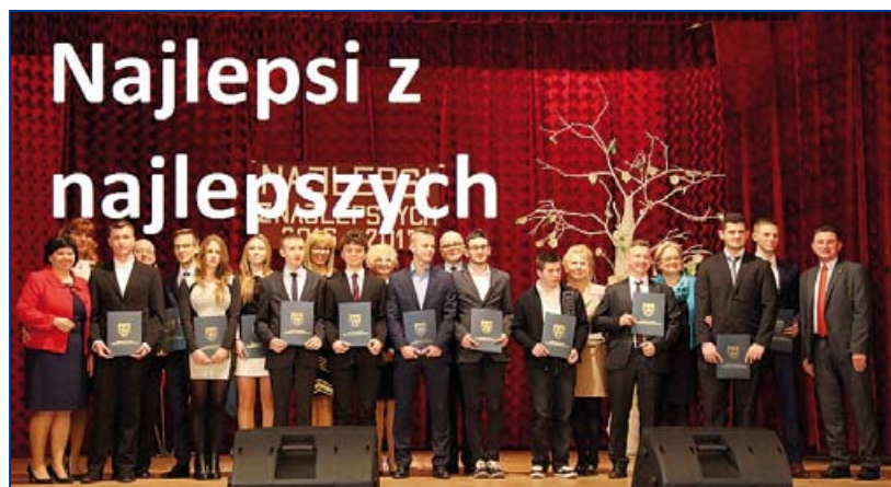
Najlepsi sportowcy młodzieży w 2016 r.