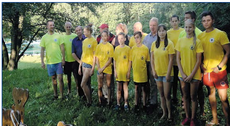
Poniżej: Nowi ratownicy drużyny WOPR Leśnica.