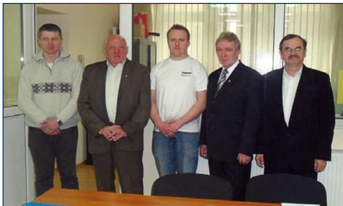
Kadra szkoleniowa kursu kwalifikowanej pierwszej pomocy.