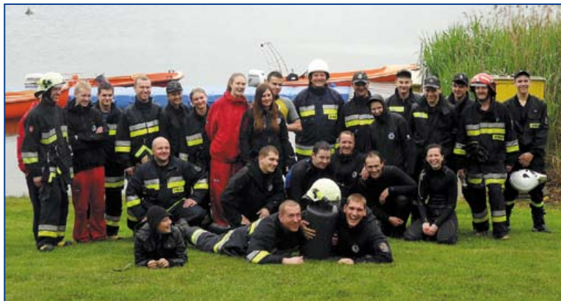
Wspólne ćwiczenia ratowników WOPR z OSP Kłodnica.