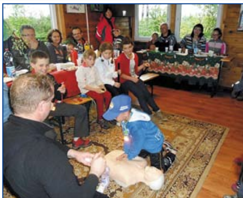
Z prawej: Pierwsza pomoc wśród dzieci na stacji WOPR Dębowa.