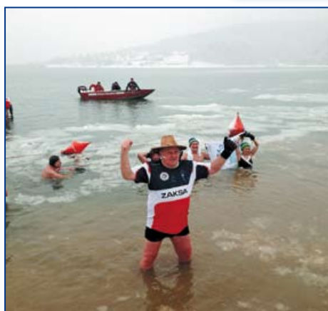
Powyżej i z lewej: Morsy w Polańczyku.