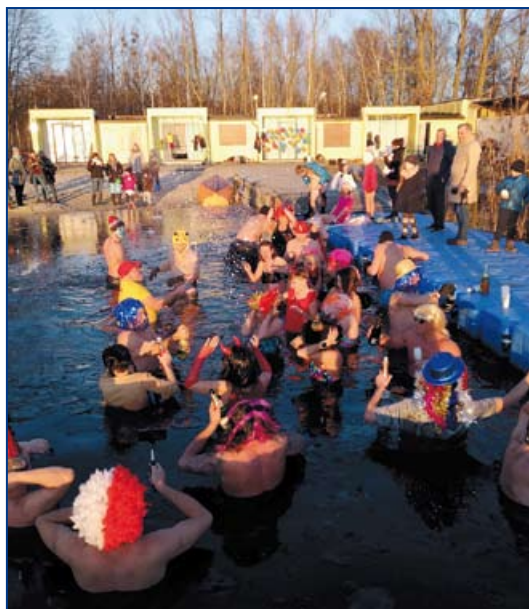
Morsy na Koksie Zdieszowice - nowy rok 2017 r.

Po zakończeniu sezonu letniego na stancji przebywają „Morsy na Koksie”.