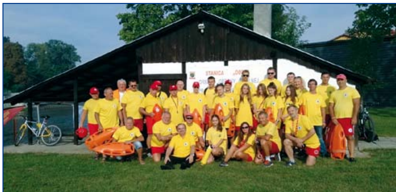
Ratownicy WOPR Kędzierzyn-Koźle i Nysy żegnający ratowników płynących do Londynu.