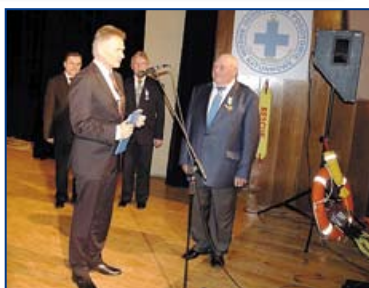
Obchody 40-lecia WOPR w Kędzierzynie Koźlu – Dom Kultury Lech w Błachowni.