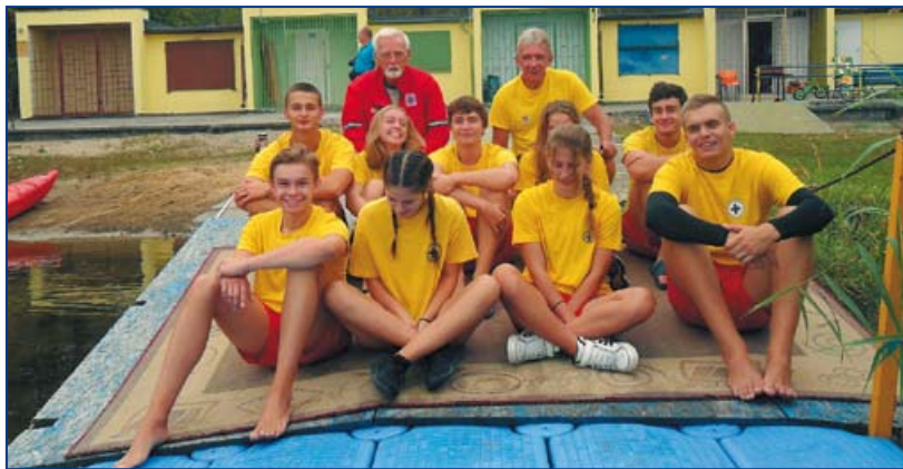
Drużyna MUKS WOPR w Januszkowicach.

Ośrodek stał się też nową bazą szkoleniową oddziału. Kursy na stopień ratownika WOPR przeprowadziły tam m.in. drużyny WOPR Leśnica – Januszkowice oraz MUKS WOPR Kędzierzyn-Koźle.