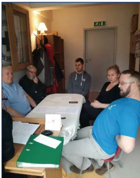
Zarząd MUKS WOPR Kędzierzyn-Koźle.