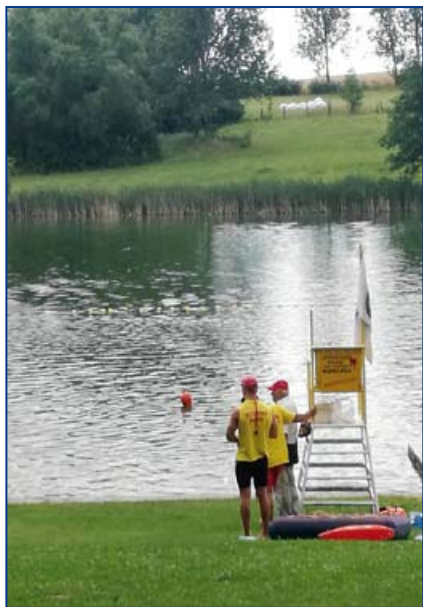
Ratownicy na kąpieliskach w Dębowej.