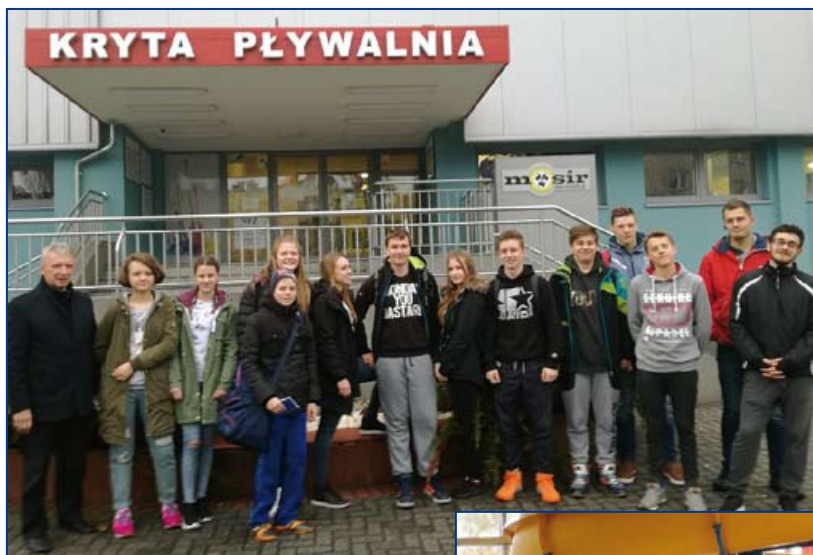
Drużyna MUKS WOPR Kędzierzyn-Koźle.