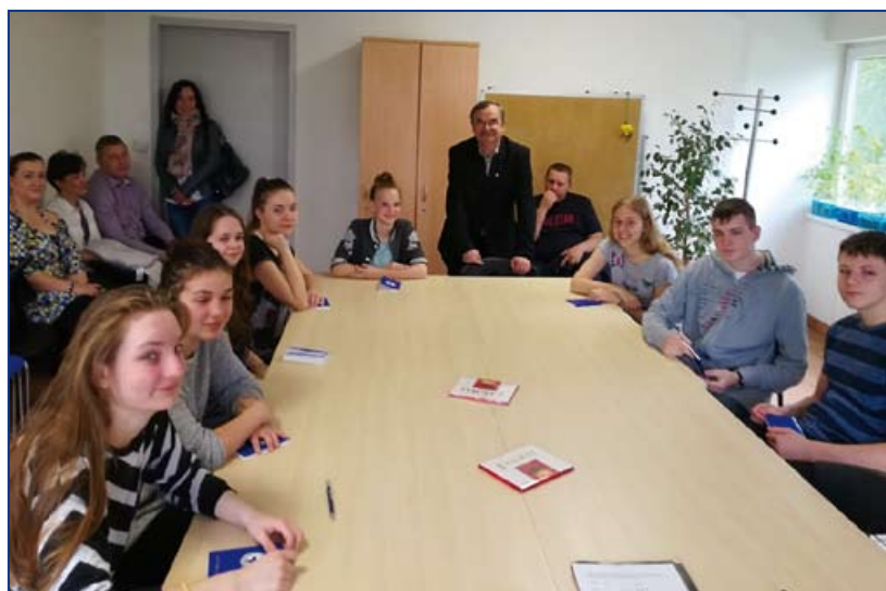
Na zdjęciach: młodzi pływacy z sekcji pływackiej MUKS WOPR Kędzierzyn-Koźle.