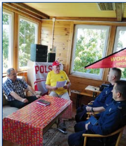
Narada z policją przed sezonem letnim Dębowa.