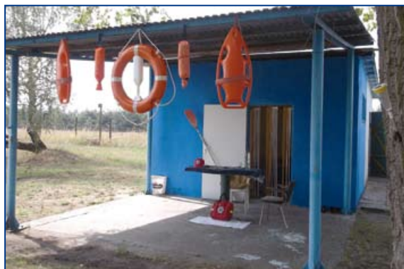
Była stacja WOPR Koksik w Januszkowicach.