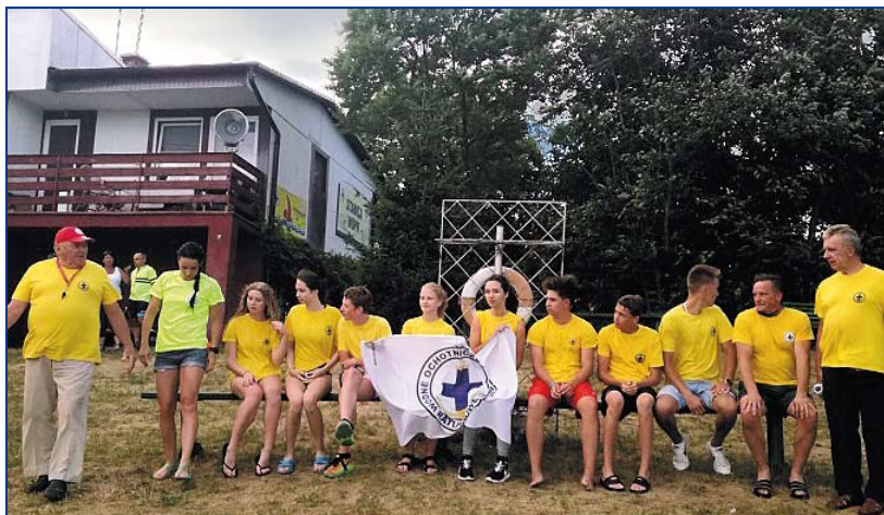
Powyżej i po lewej: Nowi ratownicy WOPR po szkoleniu na Dębowej i Strzelcach Opolskich.