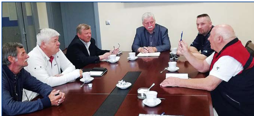
Powyżej: Narada u wójta Reńskiej Wsi przed sezonem letnim.