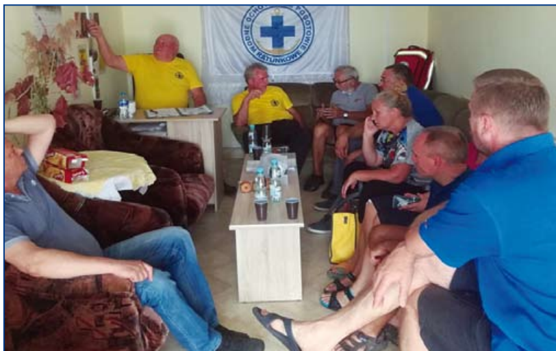
Powyżej: Posiedzenie prezydium w wyremontowanej stacji WOPR w Januszkowicach.