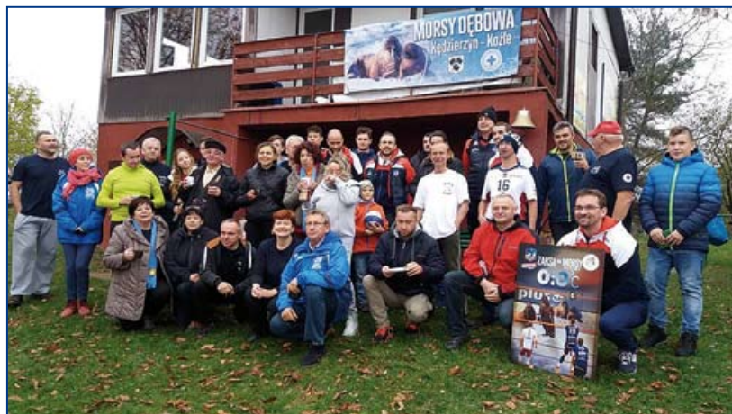
Morsy z ZAKSĄ – Dębowa.